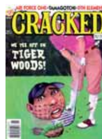
En 1997, el comic Cracked caracteriza a Tiger Woods en una de sus historietas