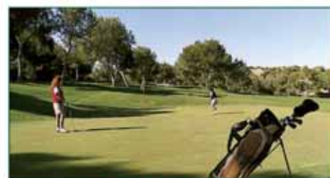
GOLF LAS RAMBLAS