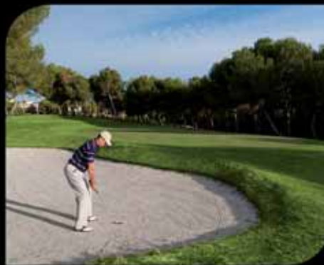
2. Las Ramblas Golf