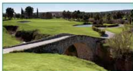
GOLF LA FINCA