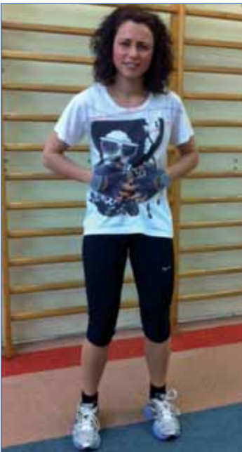
ZONA ABDOMINAL 1