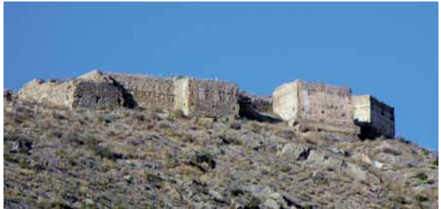
Castillo de Orihuela

Orihuela, declarada Gran Ciudad en 2010, es un municipio situado en una privilegiada y colorida zona del sureste español que cuenta con un importante patrimonio artístico monumental, y alberga joyas de la arquitectura histórica mediterránea