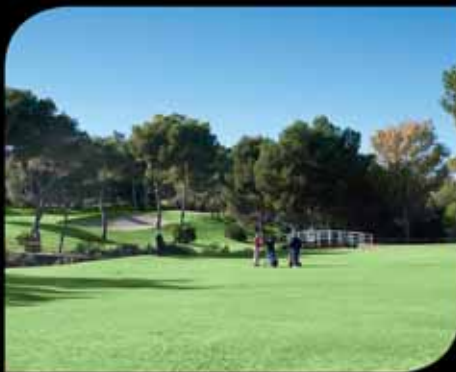
1. Villamartín Golf