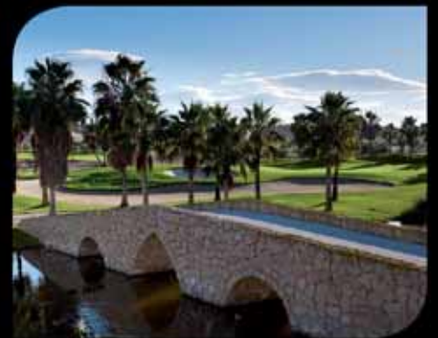
3. La Finca Golf