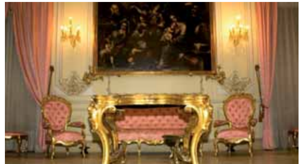
Actualmente el Palacio Rubalcava está cerrado al público

to con funciones ganaderas además de defensivas, otra serie de torres se sitúan en torno al seminario, donde se encontraba la población original.