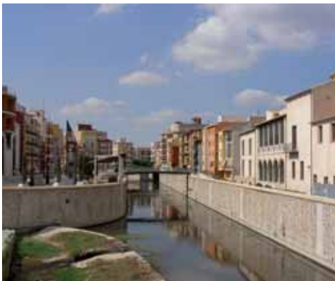
Centro de Orihuela

En él se distinguen varias zonas bien diferenciadas funcionalmente. La zona más alta la ocupa la Alcazaba, sede del poder político y militar, por debajo de ella una línea de torres delimita el albacar, recin-