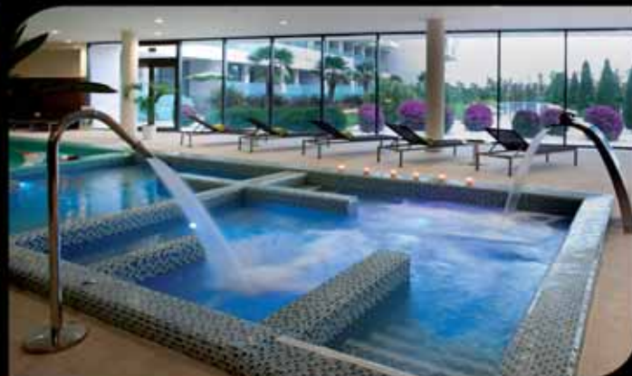
Descubre sensaciones puras